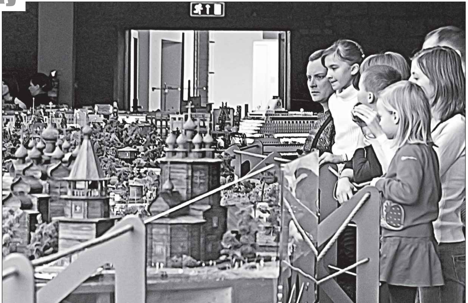
На питерском «Гранд макете России» все города выглядят чистенькими и аккуратненькими - прямо как игрушечный домик для Барби и Кена. Могут ли быть такими же города для живых россиян?

По большому счёту, настоящих достопримечательностей в Старой Руссе - всего две: дом-музей Фёдора Михайловича Достоевского да курорт с его Муравьевским фонтаном, который считается самым мощным в Европе минеральным источником (доверимся журналу «Вокруг света» 20-летней давности). Прочие немногочисленные му-