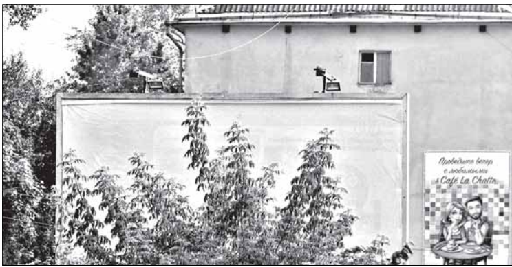
Опустела без тебя Земля... Но не везде