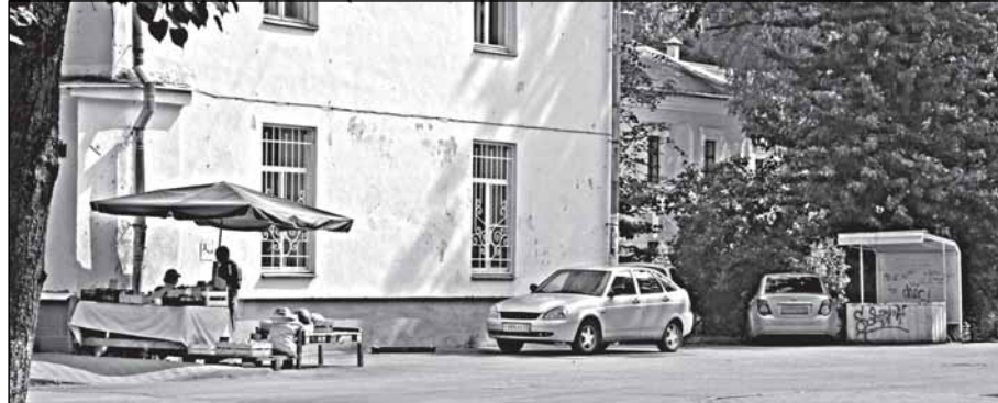
Овощи и фрукты на «красной линии» Воскресенского бульвара. Обратите внимание - чуть глубже стоит (и давно) без дела вполне цивилизованный прилавок.