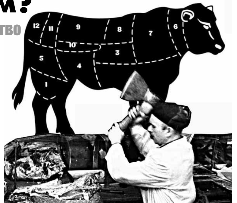
Корову растят одни, а разделяют - другие

Региональное отделение партии предлагает областной Думе в связи с несогласием жителей Песского и Минецкого сельских поселений отклонить законопроект о преобразовании муниципальных образований Хвойнинского муниципального района путём объединения всех поселений с последующим наделением вновь образованного муниципального образования статусом муниципального округа. И при решении вопроса об объединении сельских и городских поселений в муниципальные округа проводить их только через референдумы или опросы населения в соответствии с федеральным законом «Об общих принципах организации местного самоуправления в Российской Федерации» (№ 131-ФЗ).