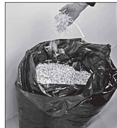
Эта «лапша» секретов уже не выдаст