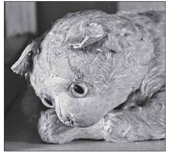
Без кошки - что за новоселье?