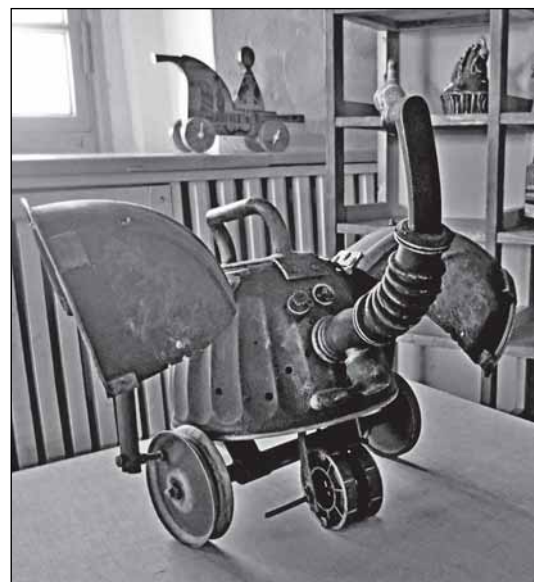
Задорный слон из чайника