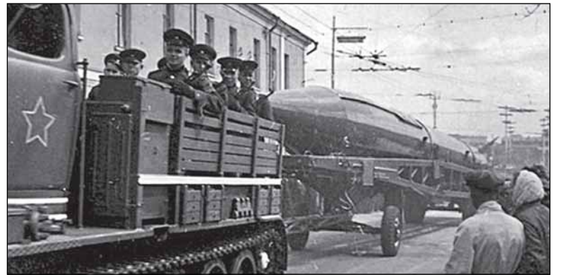
Р-5М: на полигоне и на параде в Москве

Ракета Р-5М с ядерным зарядом прошла натурное испытание 2 февраля 1956 года и с июня была принята на вооружение. Испытательный пуск был проведён на полигоне Капустин Яр. Она обеспечивала доставку к цели боевого заряда на дальность 1200 км с минимальным боковым отклонением от точки прицеливания.