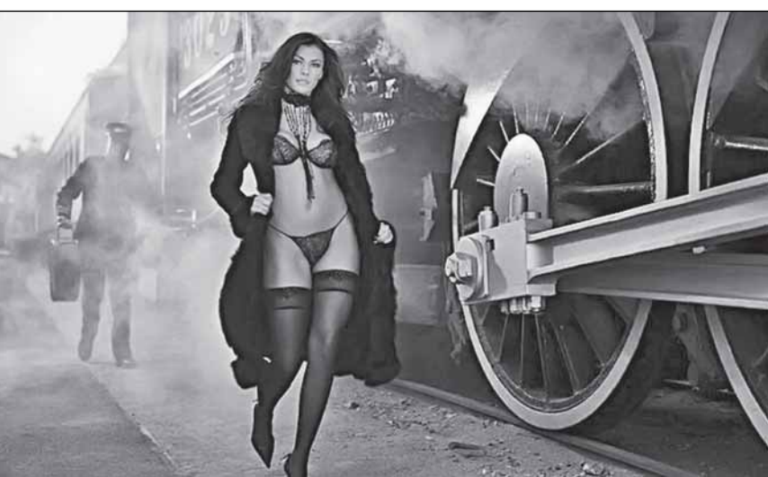
«РЖД» раздевает провинцию...

Тогда, в 2014-м, «Новая новгородская» детально разобрала «анатомию» возникшего долга («ДОРОГИЕ ПАССАЖИРОПРИЗРАКИ», №5, 2014 г.). Подробности можно найти сегодня в интернет-журнале «Портал 53» ( www.portal-53.ru ). Напомним только самые впечатляющие цифры. По экспертным оценкам услугами пригородного железнодорожного транспорта в 2013 году воспользовались около 2,5 тыс. жителей Новгородской области (включая разовые поездки). При этом средняя населённость вагона (т.е. среднее количество пассажиров, перевезенных в 1 вагоне) составила 7,9 чел./вагон - при том, что число мест в пассажирском вагоне пригородного поезда на локомотивной тяге - 64, а в пассажирском вагоне электропоезда - 90. То есть эксплуатировались практически пустые вагоны. Например, в среднем 24 человека в одном поезде при вместимости 64 человека было перевезено на маршруте Дно - Старая Русса, и большинство пассажиров - жители Псковской области. Между тем убытки, которые необходимо было компенсировать из новгородского бюджета, составили 7,3 млн. рублей.