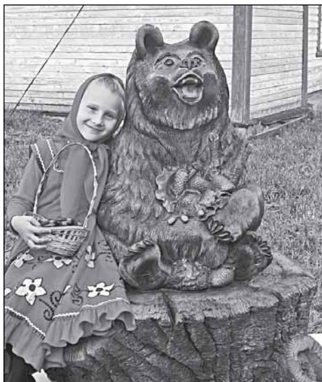
Село Медведь само себе поставило памятник: медведя

В Медведских казармах были расквартированы солдаты первых военных аракеевских поселений. Здесь до середины 1850-х гг. размещался штаб Карабинерного генерал-фельдмаршала князя Барклая де Толли полка. Туда же из Новгорода был переведён Новгородский батальон военных кантонистов, готовивший солдатских детей к военной службе. Позднее в Медведе стояли резервные батальоны, 199-й пехотный резервный Свирский полк, охранявший пленённых в ходе Русско-японской войны. Казармы в Медведе использовали для размещения дисциплинарных частей - например, после бунта солдат лейб-гвардии Преображенского полка в 1906 г. Дисциплинались здесь также подразделения Вильманstrandского и Петровского полков.