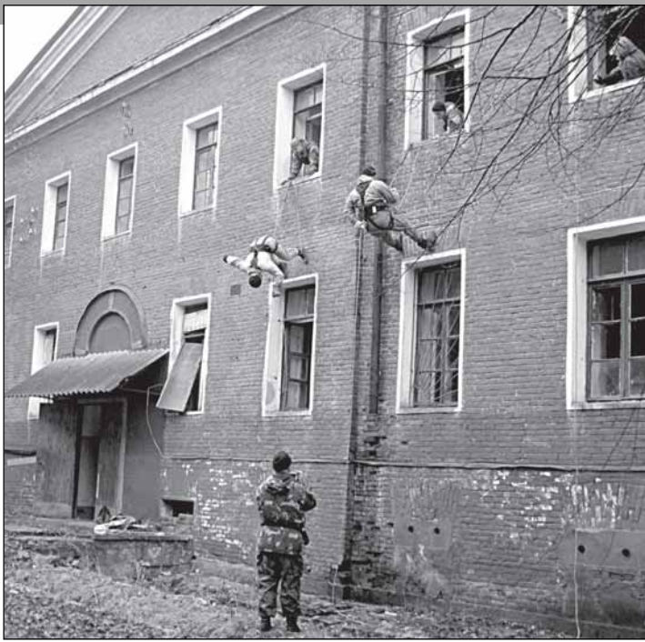
Казармы «страшной» 72-й бригады теперь годятся только, чтобы их штурмовать: работает ОМОН