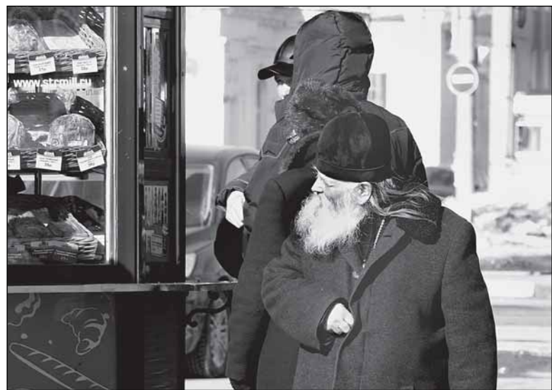
«А постные пироги у вас есть?»

- Государство сейчас даёт работать, прессинга мы вообще никогда не чувствовали, а сейчас его и по-