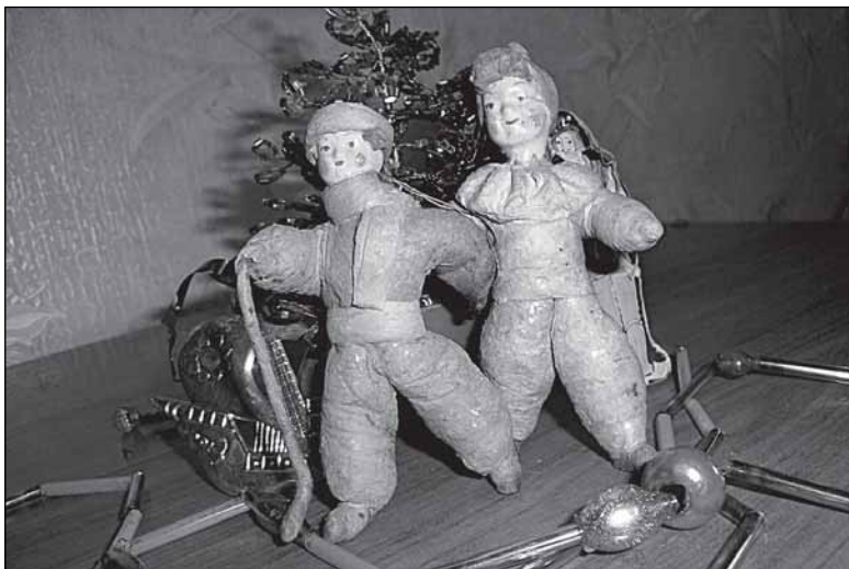
Довоенные ёлочные игрушки: лыжница (похожая, впрочем, и на игрока в хоккее с мячом) и Петрушка

весьма грубую бумагу. Основное содержание рисунков – зимние забавы деревенских детей. К ним хорошо подходило слова известных стихов Ивана Сурикова: