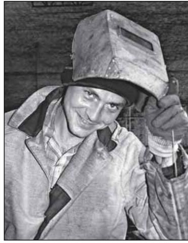
Ты телезритель? Береги глаза!