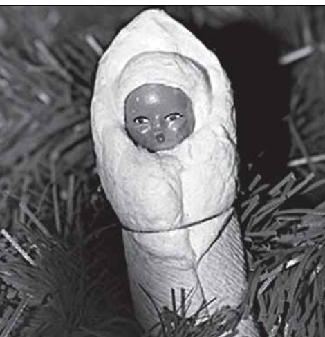
Вот такой примерно младенец...

Прошли десятилетия. Однажды сажусь в Сольцах в автобус на Новгород. Заходит ещё пассажир. Глянула - и сердце вздрогнуло: на его левой щеке виднелось большое родимое пятно. Этот человек сел впереди меня через ряд, поэтому завести разговор было неудобно. Автобус тронулся, и мужчина начал разговаривать с соседом. Сквозь рокот мотора мне всё же удалось кой-что расслышать. Человек сообщил, что всю жизнь работал в Караганде на шахтах, вышел уже на пенсию и вот на старости лет приехал в Сольцы – приехал проведать детский дом, где провёл детство. Надо же, я не ошиблась! Но сосед бывшего детдомовца оказался неразговорчивым, и беседа вскоре сошла на нет.