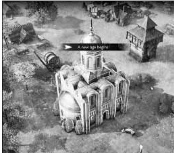
Сила - в вере

У геймеров всё проще. Сегодня Русь разбила англичан, а завтра индийские слоны потоптали русское войско. Среди удачных исторических игровых экскурсов в историю можно также назвать игру «Призрак Цусимы», где японский герой храбро сражается против монголов. Те дважды пытались покорить японс-