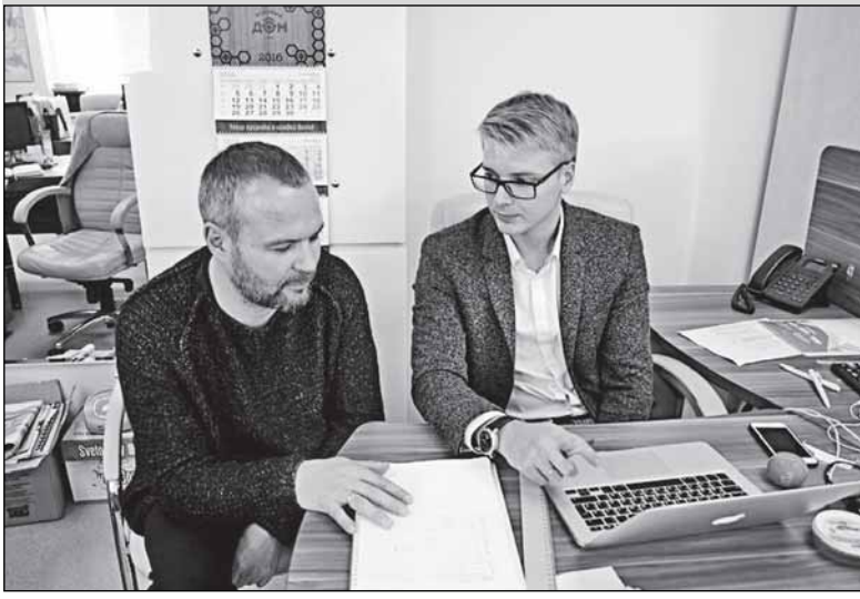
«В основном у нас работает молодёжь...»

мещений, мы оборудовали класс и оформили его в стиле фабрики. Купили мебель, учебную доску, подарили занавески от «Крестецкой строчки». Оказываем помощь и спорту, и ветеранам. Будем, конечно, посёлку помогать, но расходы не будут сопоставимыми с расходами в деревне Мойка.