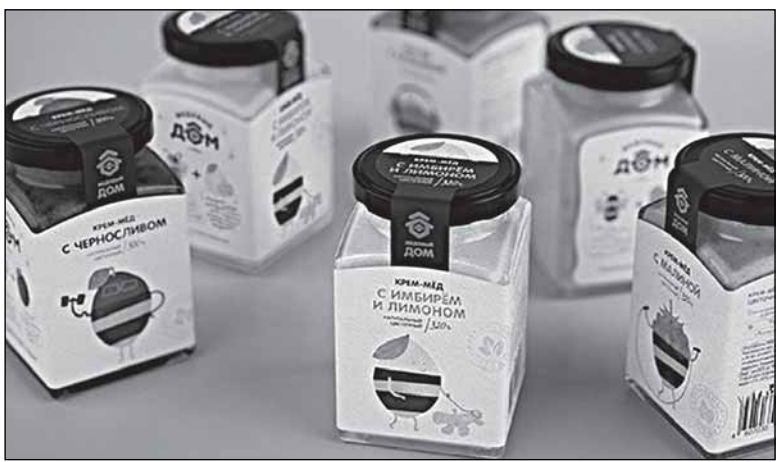
Новые этикетки с пчёлками-ягодками

Окончание - в следующем номере: о «Крестецкой строчке», политике как «отдельном бизнесе» и стоимости часов на руке.