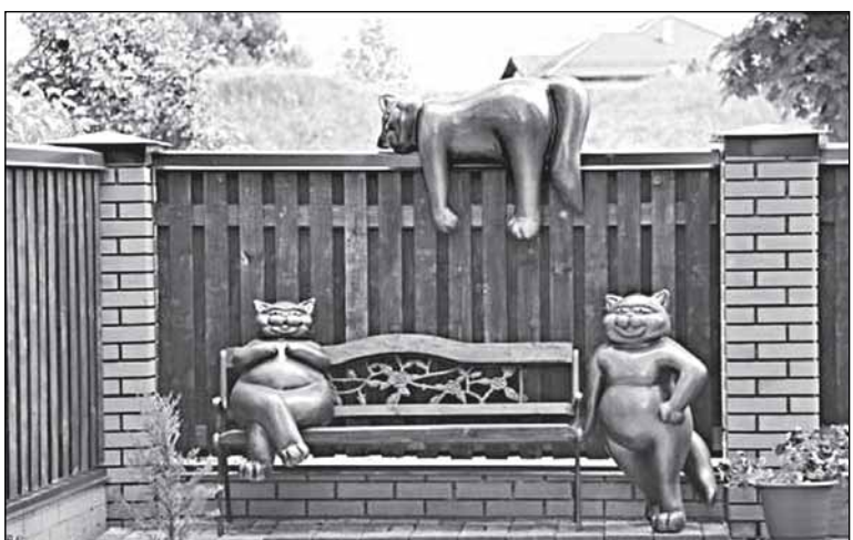
А за то, что за забором отеля - не коты в ответе