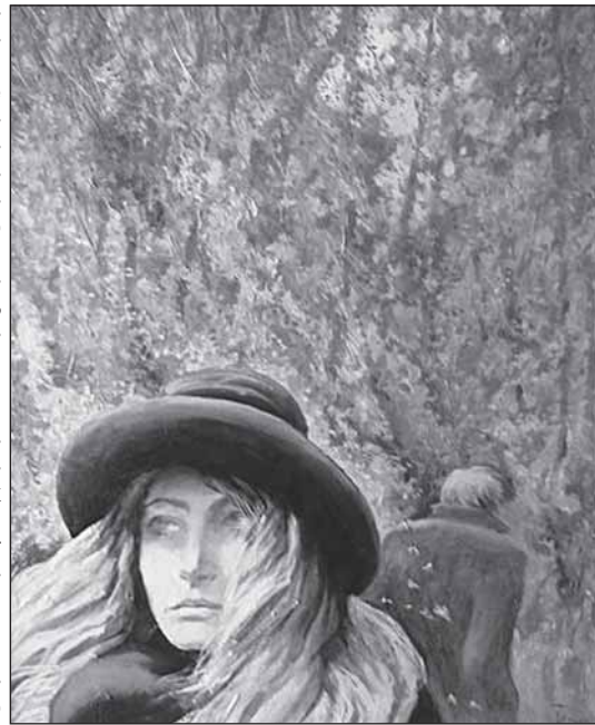
И. Тихонов «Двое»

Кроме произведений самого мастера, представлена экспозиция работ его учеников под названием «ТИХО! НОВЫЕ». Работы многообещающие, но пока лишь обещающие, пусть и много. Кто знает, возможно, в будущем жанра, должен рассеяться, ибо не дано человеку при жизни увидеть то, что должно последо-