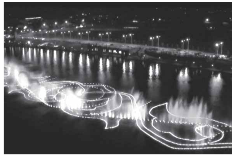
Глядя на это восточное величие, можно и забыть о кризисе

Кадыров анонсировал ранее также строительство «лучшего аэропорта в России» и самого высокого сейсмоустойчивого небоскреба в мире.