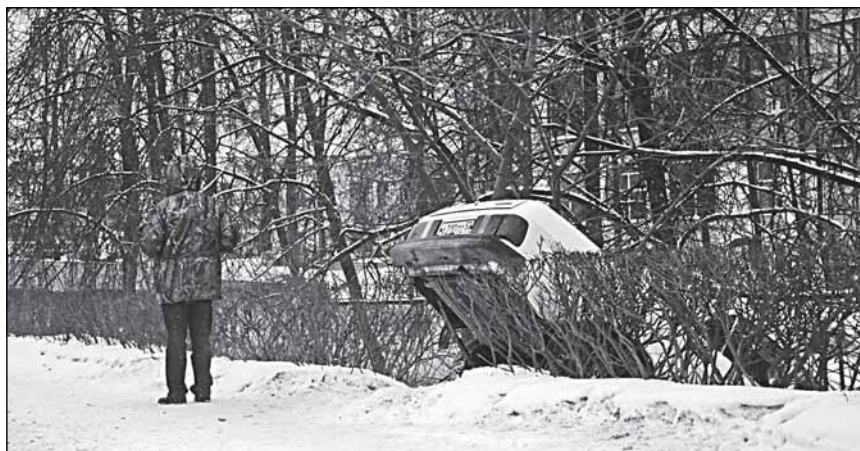
ОСАГО не должно тормозит. А водитель - должен

Информационный проект «ОСАГО: общественная экспертиза»