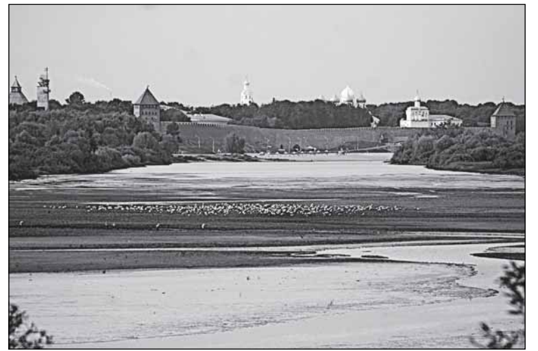
По Волхову, яко посуху