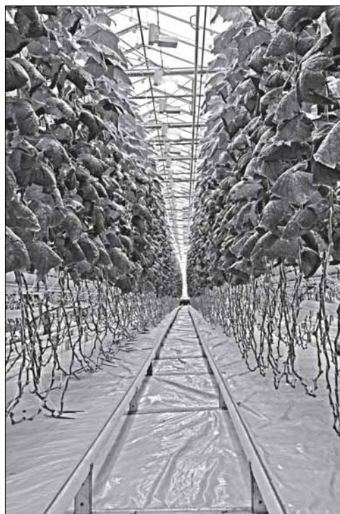
В теплицах Новгородского района

Сегодня производство мяса, которое в 2015 году составило 149,3 тыс. тонн, сосредоточено в основном в крупных агрохолдингах, таких как ООО «Белгранкорм - Великий Новгород», ООО «Новгородский бекон», ООО «Агрохолдинг «Устьволжский». На их долю приходится 89% от общего объёма производства. Это общемировая тенденция, так