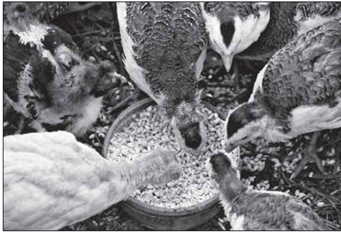
Нынешний урожай - скорее для домашнего скота?