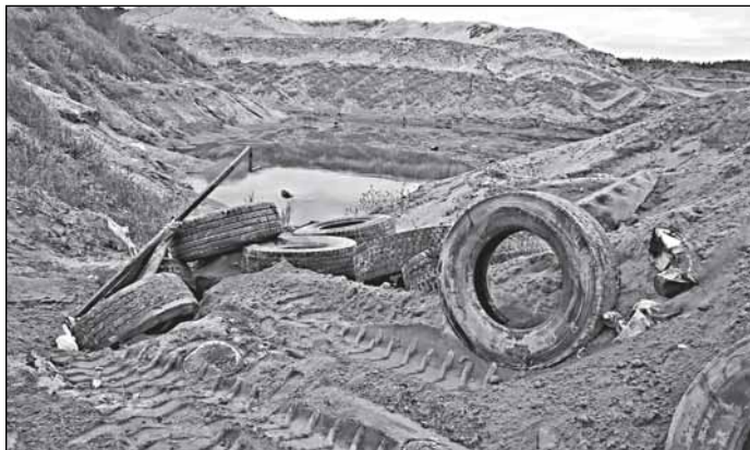
Одно дело делаешь - другого не порть