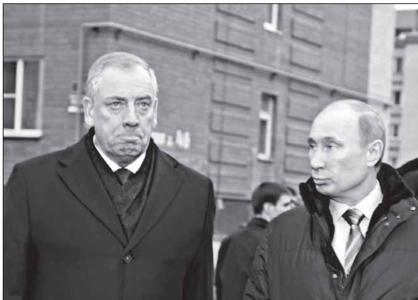
В Псковском жилом массиве Новгорода: руководство чем-то озадачено