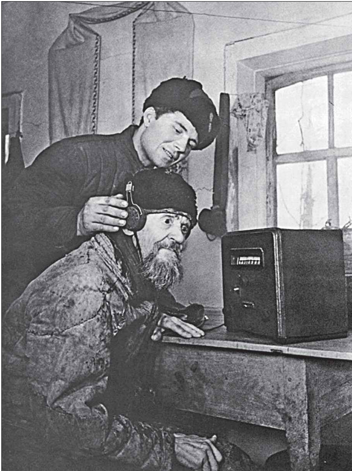
«Голос Москвы». 1943 год.