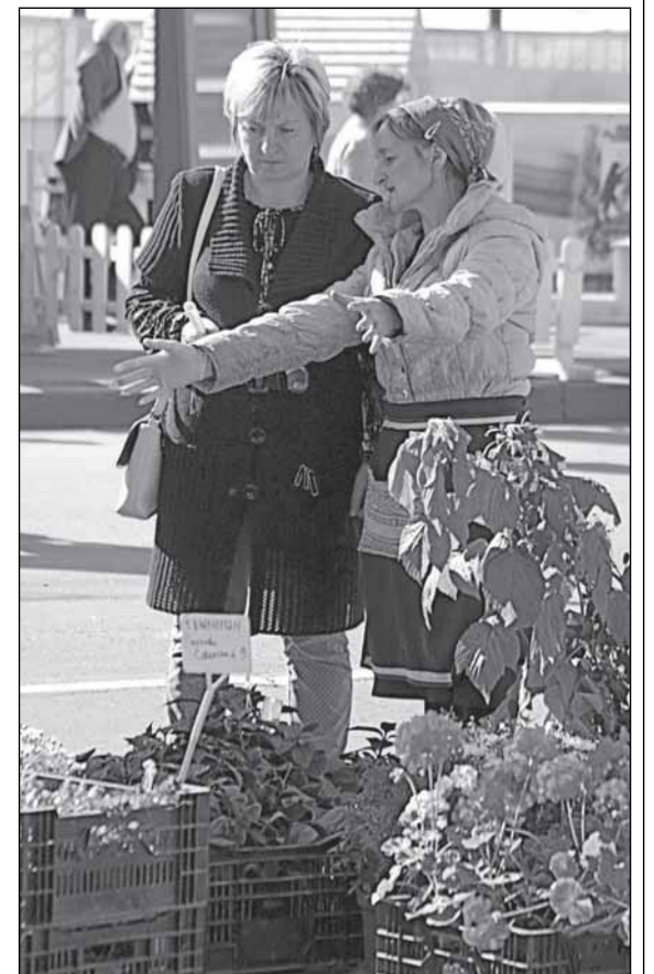
«Посадишь - во-от такая вырастет!»

Департамент экономического развития и торговли области подвёл итоги универсальной ярмарки «Всё для дачи», которая впервые прошла в Великом Новгороде 12 сентября. Свою продукцию на ней представили 130 товаропроизводителей из всех муниципальных районов области. Это - стройматериалы, изделия лесопереработки, стеновые панели, оконные блоки, беседки, садовая мебель, печи для домов и бань, эксклюзивные кованные изделия, оборудование для пчеловодства, садовые инструменты, элитные саженцы плодово-ягодных и декоративных культур, семена, сезонные овощи и фрукты - всего около 260 видов продукции.