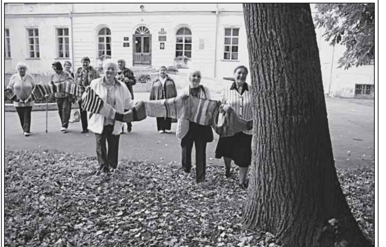
Руководительница из клуба прикладного творчества «Сударушка» (руководитель В.Д. Гребнева) связала супершарф для дерева в палисаднике Путевого дворца Екатерины Великой. Дерево - тоже ветеран, с ним надо поделиться теплом!