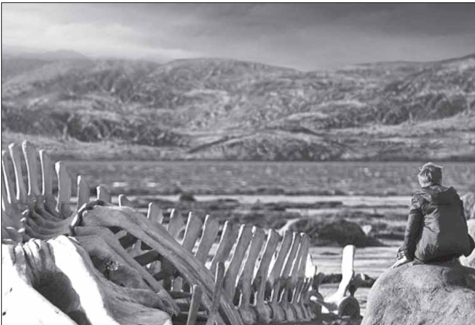
Кадр из фильма «Левиафан»...

â òãðèáãðèâ, êî òî ðîð ï ðî ñèàâèèî êèí î , í àò ñèâèâòà êèòà. òãðèáãðèâ - ñàì à ñèâèâò