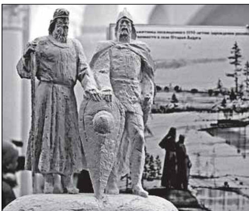
В ноябре прошлого года щит был «новгородский». Теперь - скруглился.

жение продолговатое и остроконечное, а в Старой Ладогe — круглое по совету руководителя староладожской экспедиции, заведующего