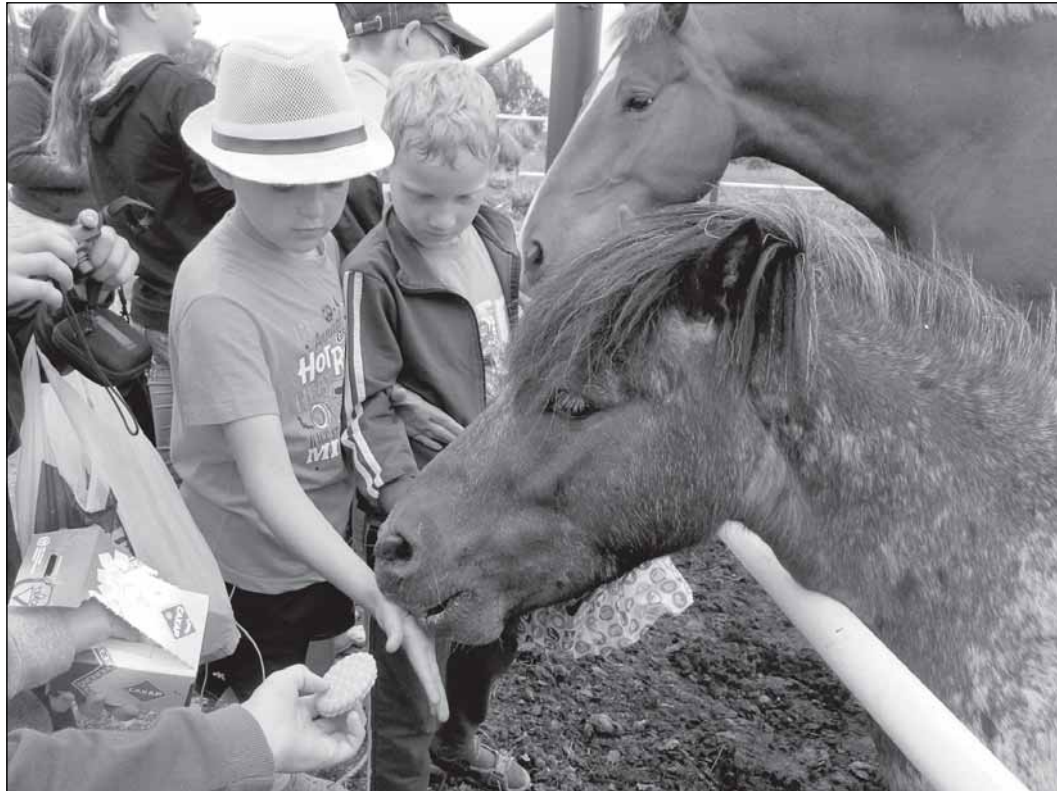
Тайсон ест всё!

Конюшня - отремонтированный бывший райповский свинарник, где обустроены денники для лошадей и подсобные помещения для обслуживающего персонала. Рядом - конкурное поле с препятствиями для обучения гривастых красавцев и для занятий конным спортом. В Новгородской области, где индекс сельскохозяйственного производства за последние годы намного увеличился, коневодство может стать одним из перспективных направлений областной целевой программы развития агропромышленного комплекса. Об этом говорилось как-то на одном из совещаний в правительстве региона, но такая конюшня, как у нас в районе, на Новгородчине - единственная. Да и во всей России разведением породистых рысак сейчас занимаются немногие. После перестройки конные заводы были разорены настолько, что лошади умирали от голода или всем поголовьем отвозились на бойню. Появившиеся частники не желали разводить национальную породу, предпочитая ей экономически более выгодного американ-