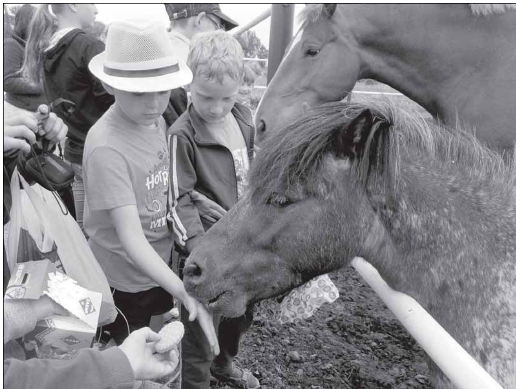
Тайсон ест всё!

Конюшня - отремонтированный бывший райповский свинарник, где обустроены денники для лошадей и подсобные помещения для обслуживающего персонала. Рядом - конкурное поле с препятствиями для обучения гривастых красавцев и для занятий конным спортом. В Новгородской области, где индекс сельскохозяйственного производства за последние годы намного увеличился, коневодство может стать одним из перспективных направлений областной целевой программы развития агропромышленного комплекса. Об этом говорилось как-то на одном из совещаний в правительстве региона, но такая конюшня, как у нас в районе, на Новгородчине - единственная. Да и во всей России разведением породистых рысак сейчас занимаются немногие. После перестройки конные заводы были разорены настолько, что лошади умирали от голода или всем поголовьем отвозились на бойню. Появившиеся частники не желали разводить национальную породу, предпочитая ей экономически более выгодного американ-