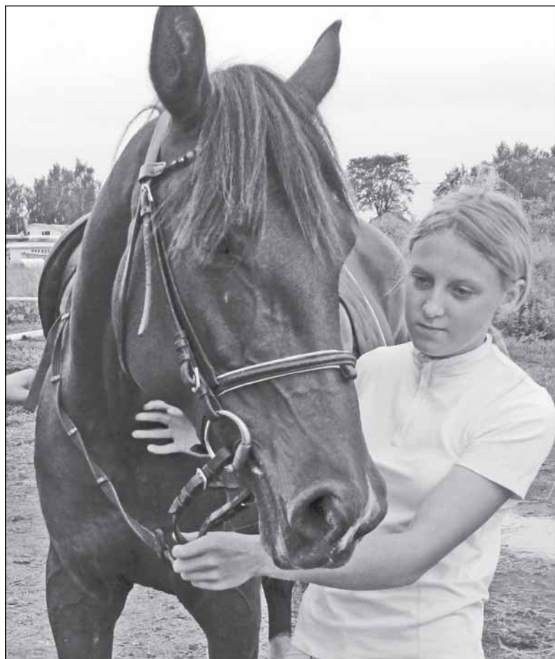
Любаша и Кокетка

кого рысак. Призовые суммы в заездах для орловцев были крайне малы. Сейчас вроде бы принимаются меры по восстановлению численности этой породы, зарегистрированной в Министерстве сельского хозяйства России в 2007 году. Орловские рысаки начали устанавливать новые рекорды. И всё же для спасения породы от гибели потребуются ещё немало усилий в течение десятков лет. Знающие люди говорят, что все основные ипподромы в наши дни заполняют как доморожденные, так и ввозимые из-за рубежа «американцы», и они вытесняют не только орловского, но и русского рысак. А ведь это наша история, наша гордость.