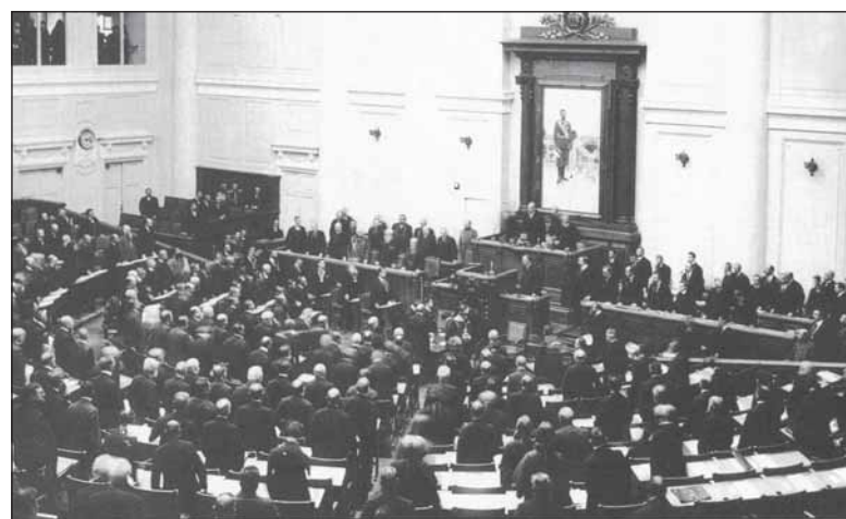
Заседание 3-й Государственной думы

Ещё один актуальный вопрос: что важнее: здоровье нации или возможность получения прибыли? И здесь имелись немалые сложности: «Мы встречаемся, например, с таким положением: в этом году на Кавказских водах администрация нашла необходимым сократить бесплатную выдачу малоимущим больным ванн и лечебных пособий, говоря, что на это уходит ежегодно 80 000 рублей казённых денег».