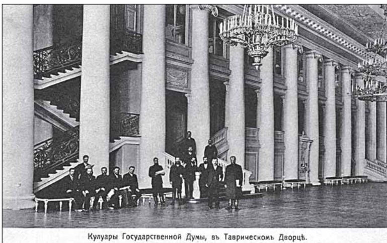
Кулуары Государственной Думы, в Таврическом Дворце.

20 ноября 1908 г. в Думе был поднят вопрос о русских курортах: «Число больных в водах Старорусских, Липецких и Сергиевских сравнительно очень незначительно. Старорусские воды по числу посещающих больных достигли только 3 000 человек в сезон, Липецкая и Сергиевская воды имеют ещё меньшее количество больных, около 1 000 человек каждый из этих курортов. Также точно и сумма годового бюджета этих трёх курортов едва превышает 100 000 рублей в год».