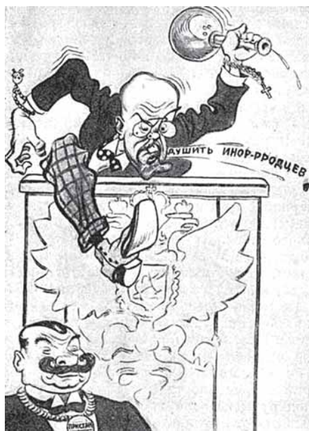
У каждой Думы, в любую эпоху, есть свои зрательные артисты, свои Пуришкевичи. Пуришкевича нашего времени вы знаете сами

Вопрос, где лучше отдыхать, за границей или на родине, был актуален и тогда: «Потребность в лечебных местах для русских слишком велика и не только потому, что нам нужно удержать те миллионы, кото-