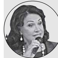
Надежда БАБКИНА, народная артистка России: