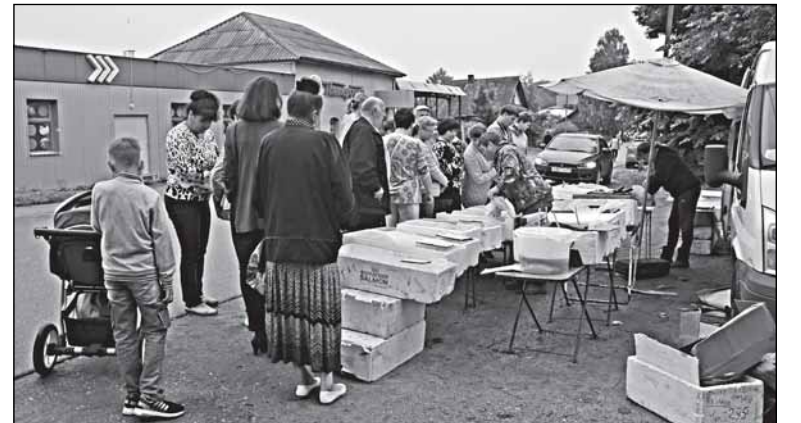
Валдай. Уличная очередь за рыбой. За рыбой - морской. Кальмара в озёрном краю купить проще, чем местную речную рыбу