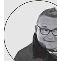
Александр ВАСИЛЬЕВ, историк моды, телеведущий:

ощущение грамотного отношения к меху. И белая пелерина невесты была прелестной.