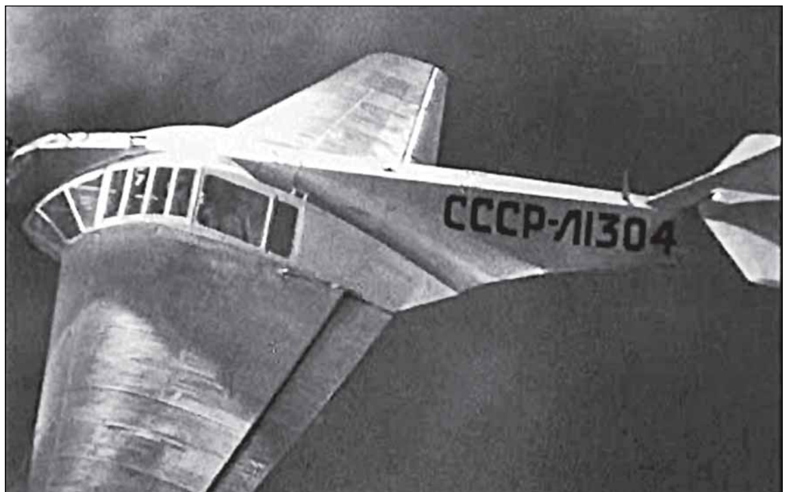
На съёмках популярного в своё время фильма «Семеро смелых» использовались самолёты «Фанера-2», созданные в Ленинграде в 1933 г. и названные по основному материалу, из которого их изготавливали. Всего было построено 20 экземпляров «Фанеры». При необходимости она могла летать без посадки почти 7 часов.

«Для Парфина это возможность за короткие сроки дать людям обновлённую территорию бульвара, достопримечательность, где они бы могли проводить время с комфортом, узнать об истории города и гордиться ею», - уверен Комов.