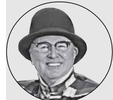
Вячеслав ЗАЙЦЕВ, российский художник-модельер:

Все можно стерпеть, а вот без шубки – никак! Я восхищена людьми, которые создают меховые изделия для того, чтобы женщины стали более очаровательными, научились любить и ценить себя – в конце концов, чтобы нравиться мужчинам! А для этого надо идти на Новоторжскую ярмарку и покупать шубы – из разного меха, разных фасонов, какие душе угодно!