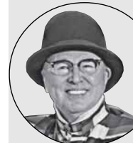
Вячеслав ЗАЙЦЕВ, российский художник-модельер:

Все можно стерпеть, а вот без шубки – никак! Я восхищена людьми, которые создают меховые изделия для того, чтобы женщины стали более очаровательными, научились любить и ценить себя – в конце концов, чтобы нравиться мужчинам! А для этого надо идти на Новоторжскую ярмарку и покупать шубы – из разного меха, разных фасонов, какие душе угодно!