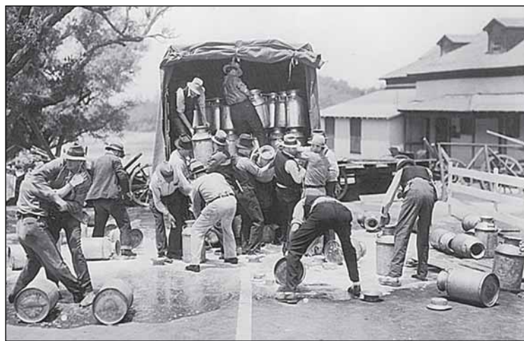
Великая Депрессия. В США выливают на землю молоко. Обратите внимание на пару в левом углу снимка: какому-то фермеру, видимо, не нравится процедура, и он вступил в драку

все памятники истории и архитектуры древнейшего города России в местную собственность или, наоборот, все они должны находиться в собственности и под полным управлением Российской Федерации? Проблема была вызвана плачевным на тот момент состоянием знаменитого памятника 1000-летию Российской госу-