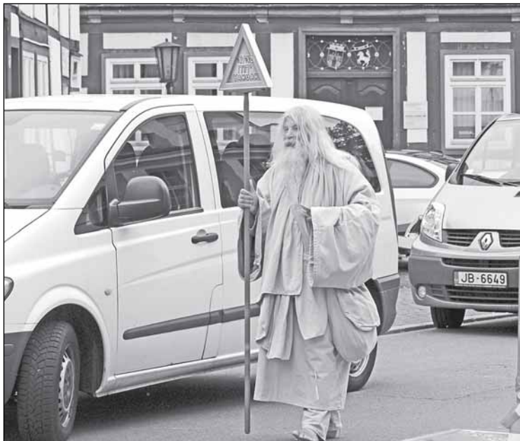
Германия. Несмотря на повышенные меры безопасности во время праздника в провинциальном городе, бродячий проповедник (видимо, иеговист) вызывает разве что любопытство, но не возмущение, - в том числе у полицейского