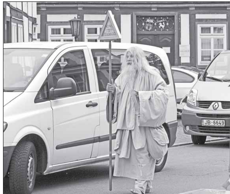
Германия. Несмотря на повышенные меры безопасности во время праздника в провинциальном городе, бродячий проповедник (видимо, иеговист) вызывает разве что любопытство, но не возмущение, - в том числе у полицейского