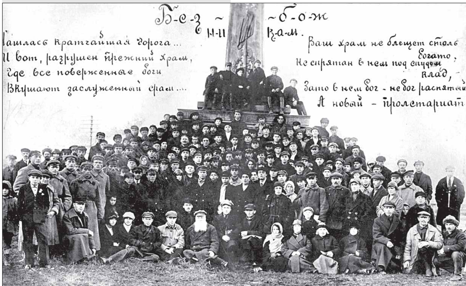
Участники 1-й Новгородской городской конференции «Союза безбожников» около памятника Новгородскому ополчению 1812 г. 15 октября 1925 г.