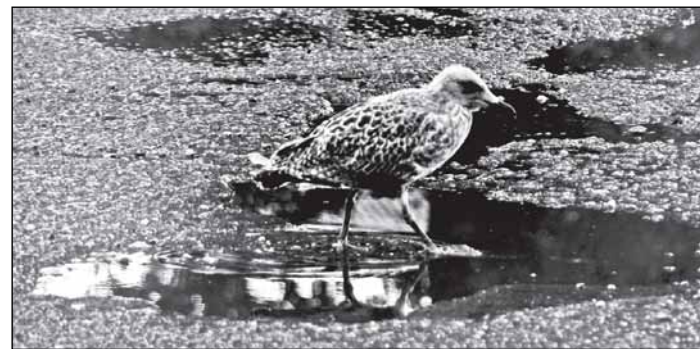
Птенец серебристой чайки

Бяшу выпустили на волю там, где меньше всего городского шума и много воды.