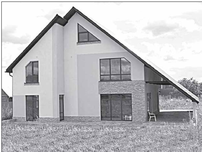
Велокс в Саратове

счет минерализации древесные щепоцементные плиты не горят, не гниют, влагостойки, сохраняют геометрические размеры, не подвержены процессам старения. Структура материала несъемной опалубки обеспечивает хороший воздушный обмен, стены «дышат», и в монолитных домах создается комфортный микроклимат, как в традиционном деревянном доме. Возводятся дома в короткие сроки. Минимум — два месяца.