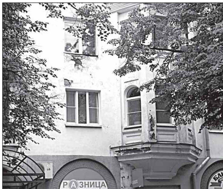
Великий Новгород, Людогоща, 10