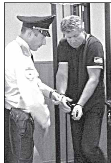
Наручники долой! Пока?

На мой взгляд, эта недосказанность - главная интрига в уголовном деле № 9905, и его расследование обещает принести ещё немало сюрпризов.