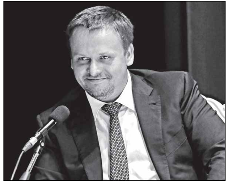
Исполняющий обязанности губернатора доволен...

ляют нервничать чиновного караса, - в зале оказалось меньше, чем в городе. А некоторым из них просто не давали микрофона.