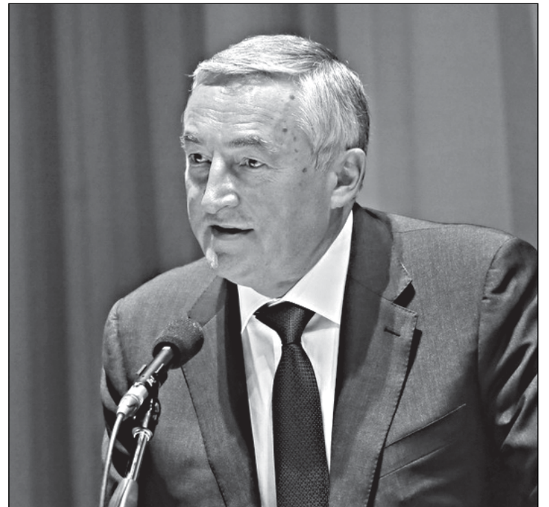
Мэр - мажорен...