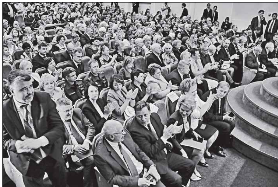
...и «партхозактив» рукоплещет