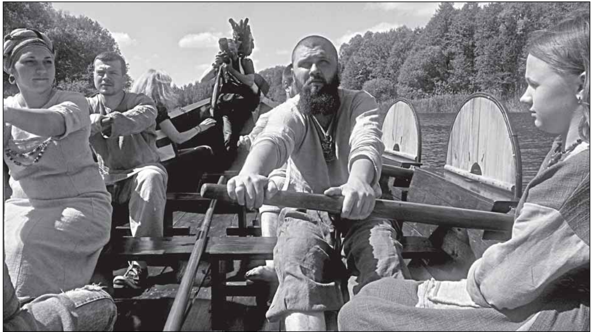
Семейный подряд на веслах