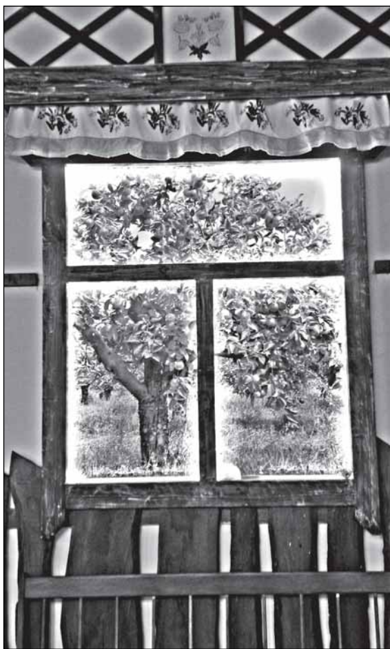
Яблоко как свет в окошке