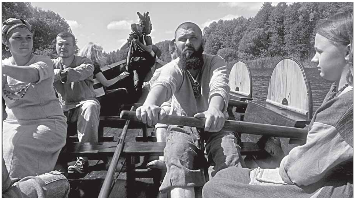
Семейный подряд на веслах