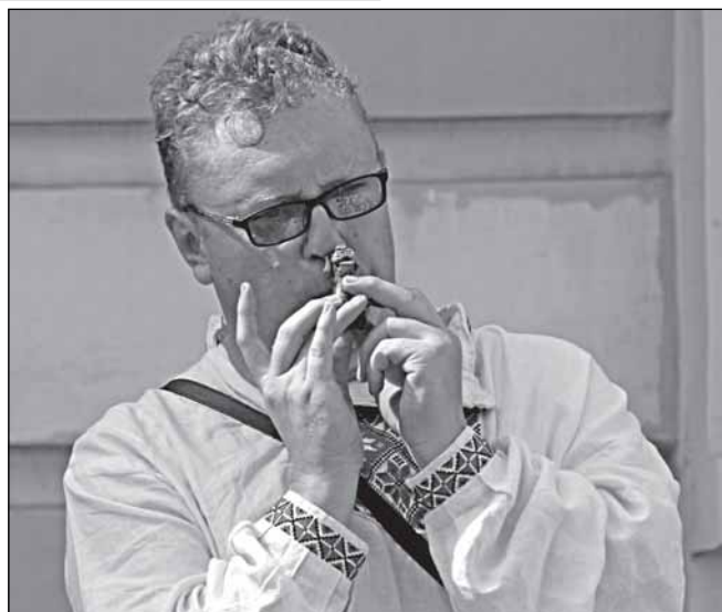
Два искусства: мирное и не очень