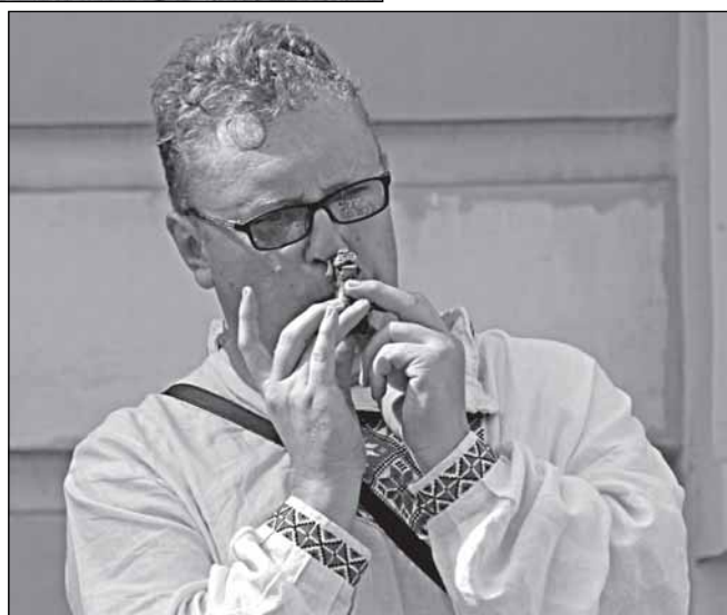
Два искусства: мирное и не очень