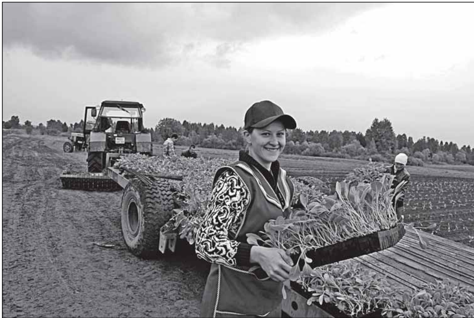
Посадка рассады капусты - дело тонкое

рый в год производит сельскохозяйственной продукции более чем на 30 млн. рублей. Просил же я всего-то 2,5 млн. рублей, чтобы купить картофелекопатель, который на подходе из Германии.