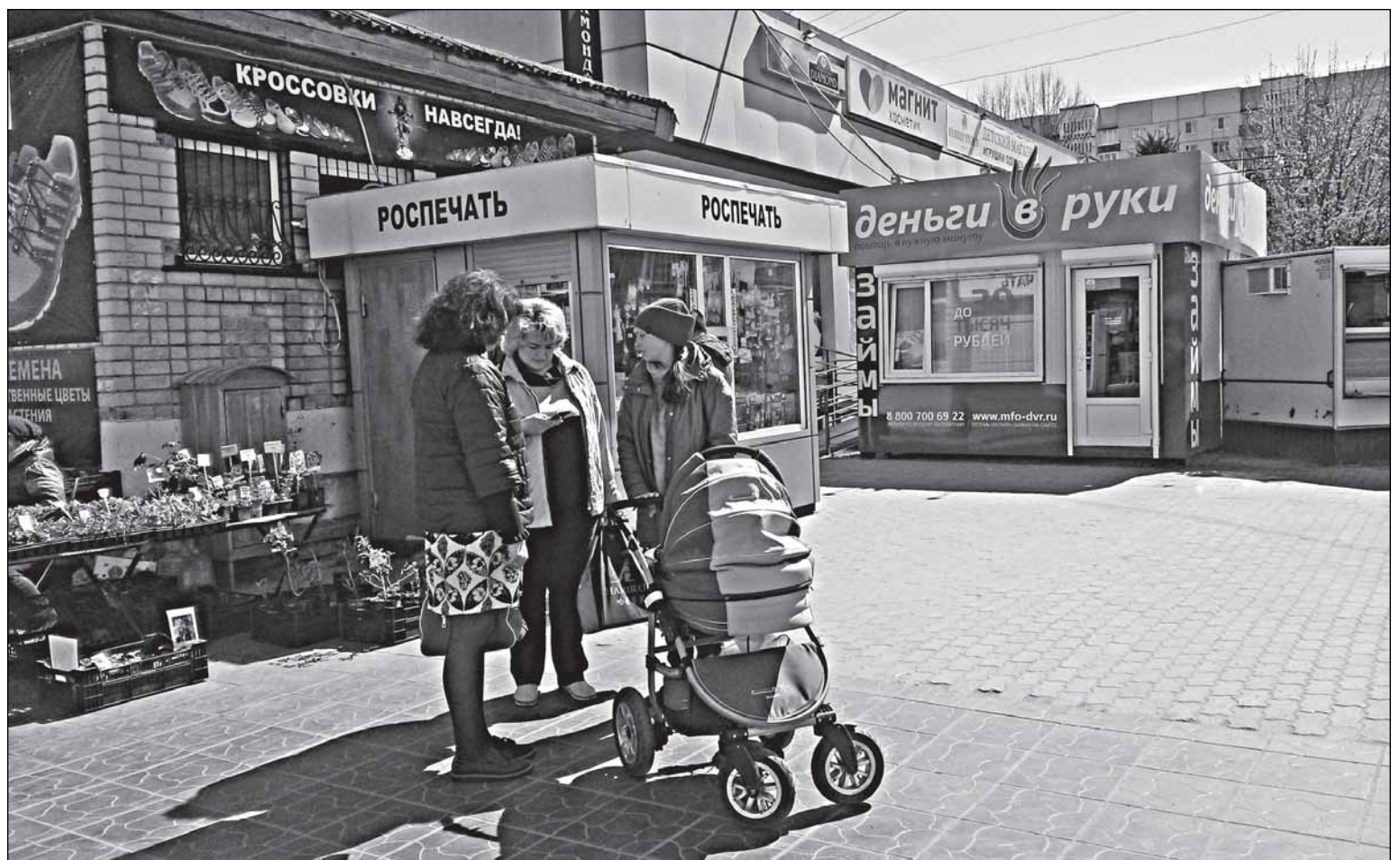
Мамам тоже приходится соображать на троих

При такой арифметике смело можно утверждать, что потенциально 150 тысяч человек, то есть по-