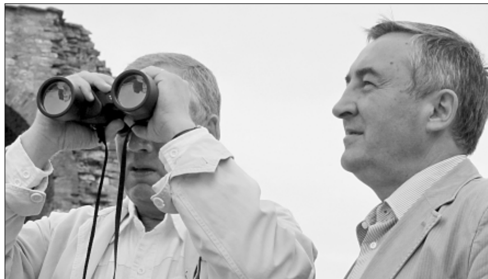
Губернатору видно дальше?

Полагаю, что главной «мишенью» обнародованной в минувшем апреле пресловутой стратегии «свержения» Сергея Митина мог быть негодный мэр вместе с высокопоставленными покровителями в Москве. Ведь тут же появилась закулисная информация - мол, вабанк Юрий Бобрышев пошёл, посчитав, что ему по плечу губернаторская ноша, так как он сохранил за собой место в руководстве Союза го-