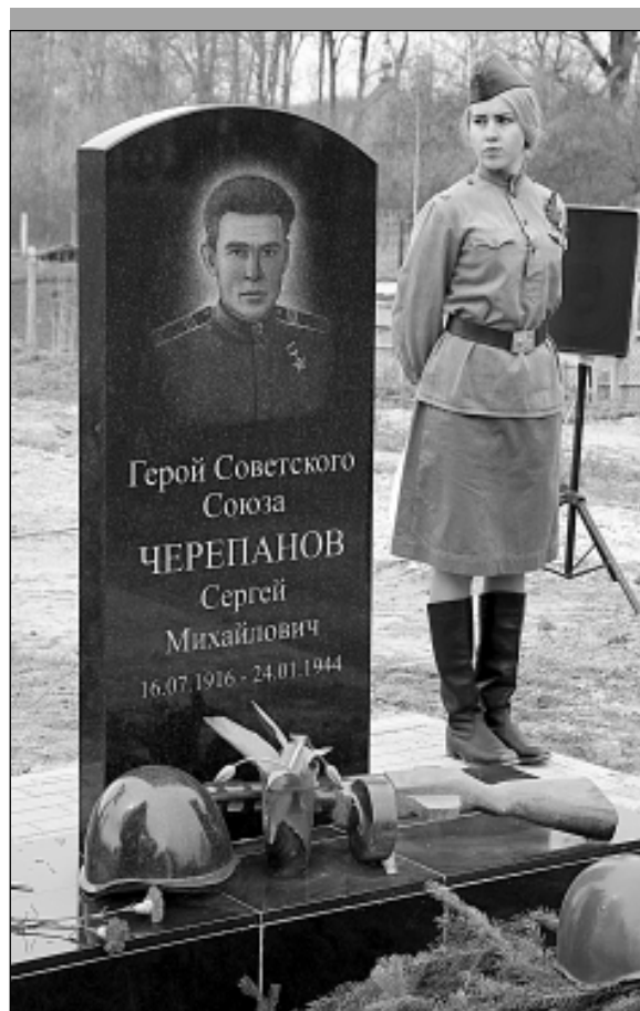
Красиво, но... недостоверно: герой никак не мог носить Золотую Звезду, которой удостоен посмертно. К тому же к медали прилагается орден Ленина...

Примечательный штрих: старожилам Нового Бора будущий Герой Советского Союза запомнился в первую очередь тем, что снимал головной убор перед теми, кто был старше его.