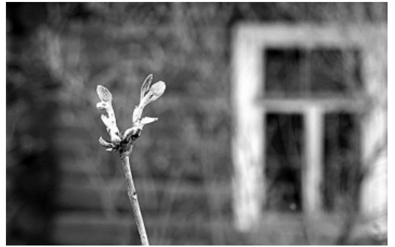
На обновлённом мемориале посадили клёны, каштаны и берёзы