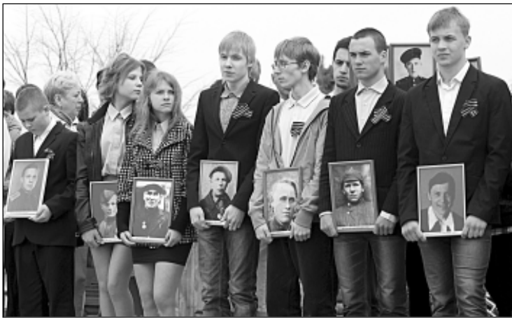
В этот день в деревне провели акцию «Бессмертный полк». В Новгородском районе домой вернулся только каждый третий из ушедших на фронт....

Тут можно поспорить, пожалуй. Я помню «дальнее» кладбище ещё по 70-м годам прошлого века. Помню, что местным школьникам вполне удавалось ухаживать за ним. Да и по выложенным в Интернет фотографиям мемориала, подготовленного к переносу, видно, что