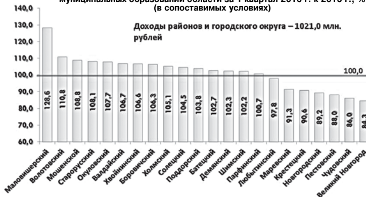
Темпы роста поступления налоговых и неналоговых доходов муниципальных образований области за 1 квартал 2016 г. к 2015 г., % (в сопоставимых условиях)

ние межведомственной рабочей группы по противодействию правонарушениям и преступлениям в экономической и социальной сферах, куда были приглашены руководители организаций-должников.