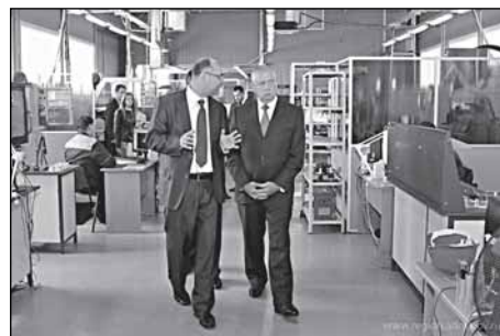
Губернатор - частый гость на «ЭЛСИ»

- Самодостаточность предприятия проявляется в его эффективности, - отметил губернатор. - Объём производства в рублёвом эквиваленте составляет на каждого работающего предприятия порядка 1,5 миллионов рублей. В этом и проявляется самодостаточность. Здесь представлено самое современное оборудование. Это радует, и гордость берет за то, что новгородцы производят изделия, соответствующие лучшим мировым аналогам. Мы будем всячески содействовать и помогать предприятию со столь уникальным и нужным региону производством».