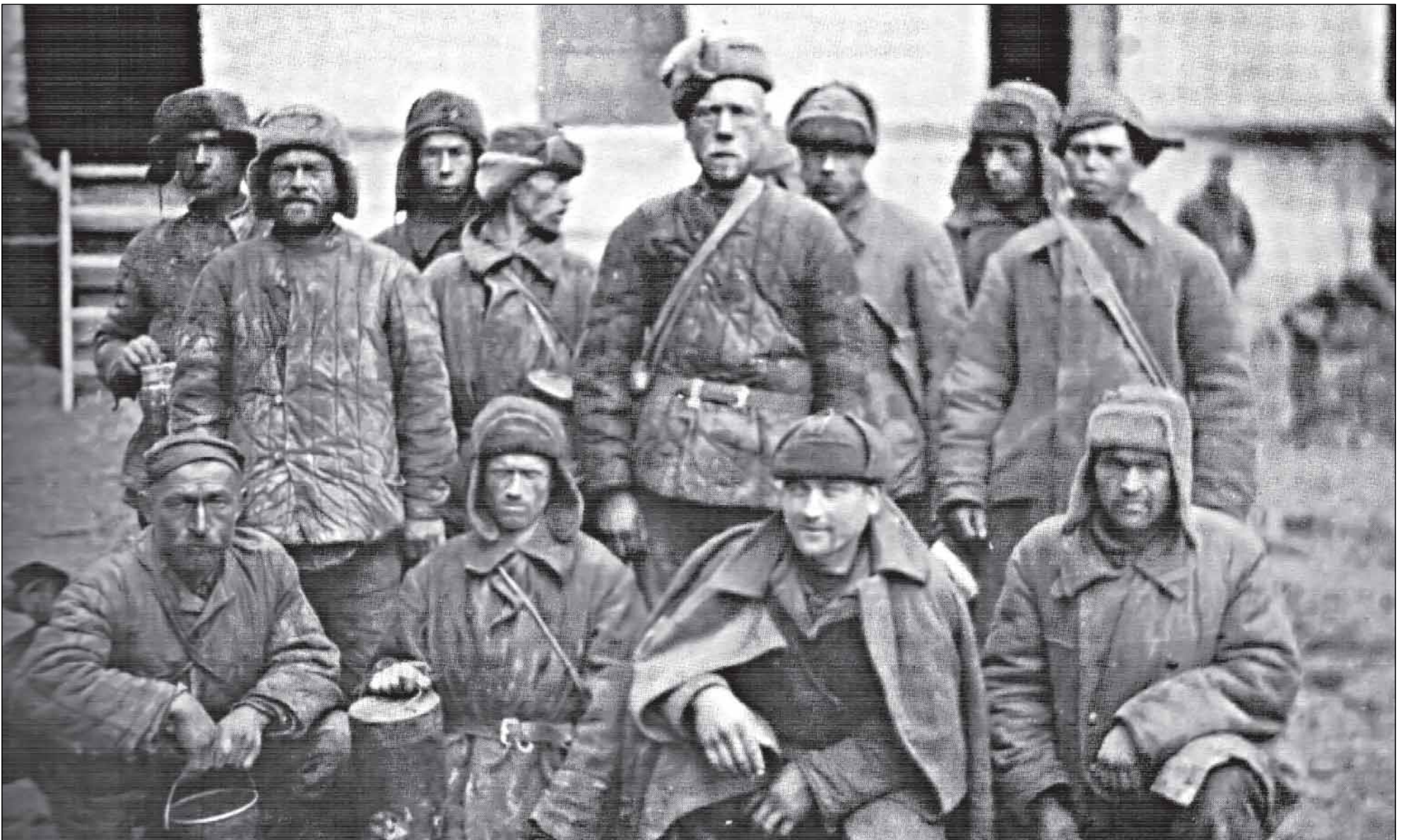
Советские военнопленные в Новгородском времле