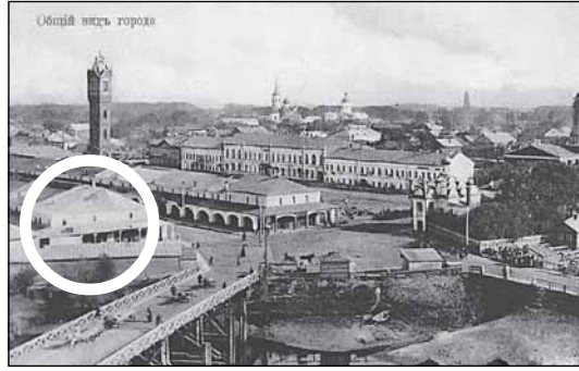
Кружками отмечены предполагаемая стела «Город воинской славы» и торговое сооружение прошлого, от которого, возможно, и остались подземные склады

должен будет городской бюджет (ну или некий спонсор, который возьмёт на себя расходы по строительству). Думаю, что Руссе (в бюджете которой нет денег даже на