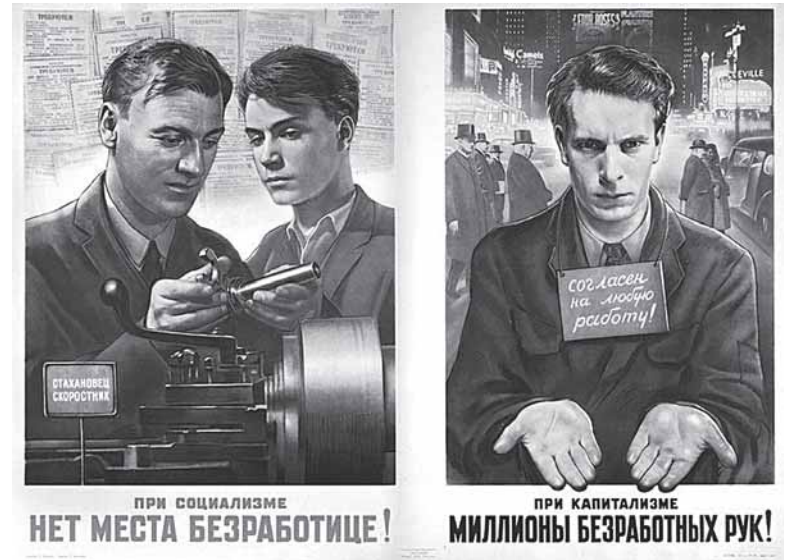
Левая часть этого советского плаката, конечно, устарела: мы знаем особенности тогдашнего рынка труда. Но правая - вполне актуальна

«Для тех работодателей, которые примут решение участвовать в программе, это шанс подобрать себе специалистов из числа высвобождающихся работников и выпускников профессиональных образовательных организаций, за