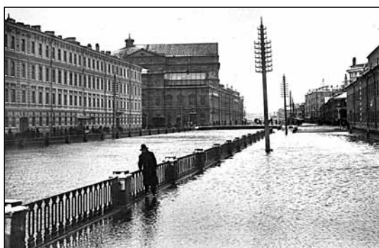
Упомянутое здесь шестичасовое наводнение 1924 года в Ленинграде, когда невская вода поднялась на 369 см выше ординара, вошло в историю как второй крупнейший удар стихии по городу. Более сильным было лишь наводнение 1824 года с подъёмом воды на 410 см.