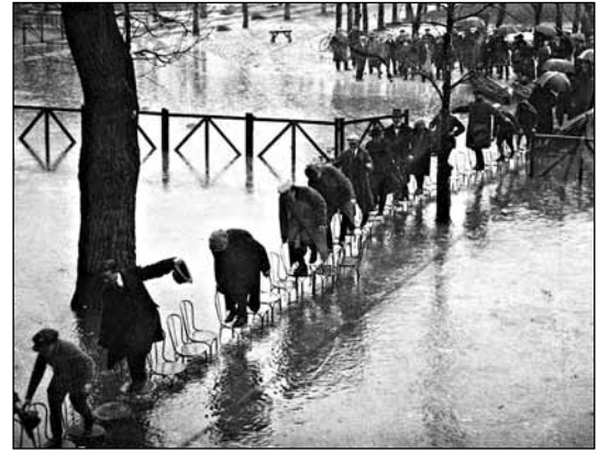
Наводнение в Париже, 1924 год