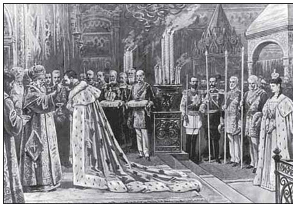
Миропомазание Николая II