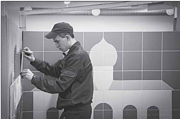
На новгородских соревнованиях WorldSkills