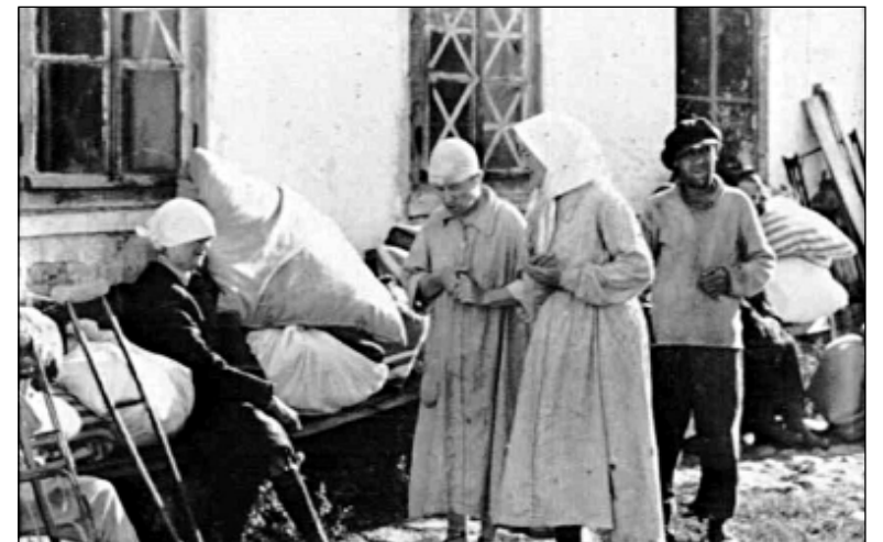
Психиатрическая больница в Колмове

Паника захватила людей в свои цепкие лапы и.... понесла. Без мысли, без рассуждения, поднялись, подхватили узлы и бросились через мост, на Торговую сторону, где почему-то казалось была ещё власть, которая обязана и может указать путь, куда бежать и где спастись. Это был психоз, тот массовый роковой психоз, который в переполненном здании при одном только крике: пожар! приводит к бесчисленным жертвам давящих друг друга, безумных от страха, людей. Люди бежали и падали, бросали