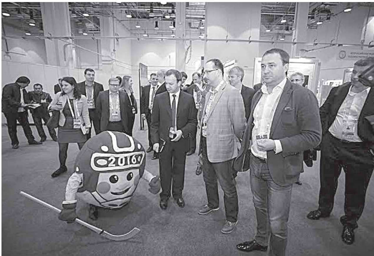
Вице-премьер Аркадий Дворкович знакомится с талисманом чемпионата мира в Ульяновске - колобком. Персонаж русской сказки был отважен и верил в себя, но в финале, напомним, лиса его всё-таки - «ам, и съела». Возможно, это была шведская лиса...

Сборная России выиграла домашний чемпионат мира по хоккею с мячом 2016 года в Ульяновске, победив финнов со счётом 6:1. Заметим, что сборная СССР/России выиграла 23 из 35 чемпионатов мира по «русскому хоккею», он же банди, в том числе все первые 10 первенств подряд, шведы - 11. Один раз золото первенства планеты доставалось финнам. Российский период истории нашей команды, начавшийся с 1993 года и вобравший в себя 19 «мундиалей», принёс ей 10 побед.