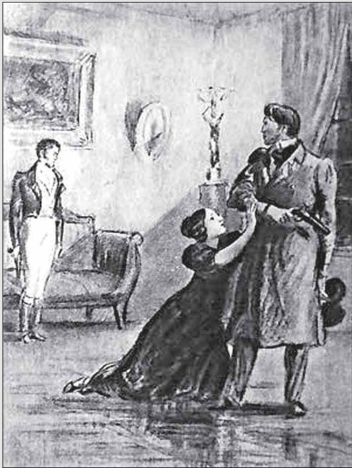
Иллюстрация к повести А.С. Пушкина «Выстрел»

«Дуэльным кодексом именовали свод правил, регламентирующих проведение дуэли... В настоящее время в большинстве государств мира дуэль на смертоносном оружии является незаконной. Участие в ней подпадает под действие уголовного закона и рассматривается, в зависимости от реальных обстоятельств, как убийство, причинение вреда здоровью, покушение на убийство.» («Правила русской дуэли»)