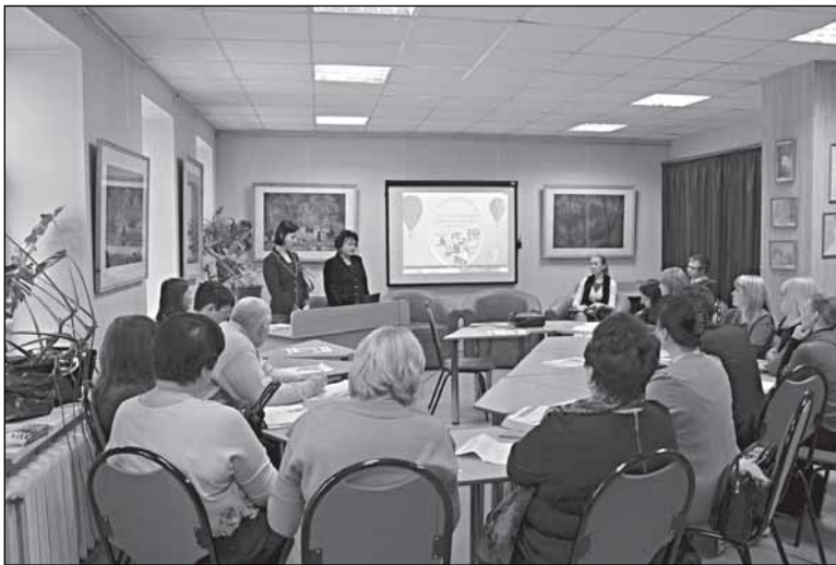
В Фонде поддержки социального предпринимательства

- А с доходом что? - Ну, выходим в плюс: тысячи три, четыре в месяц выходит. Это как маленький дополнительный заработок к основной работе. Конечно, сейчас зарабатывать исключительно на социальном предпринимательстве нельзя. Но в перспективе это возможно.