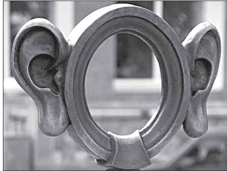
Наверное, хорошо было бы иметь такие нечувствительные органы слуха, как у бронзовой статуи «Пермяк-солёные уши» в Перми

смешку, порождает правовой нигилизм и неуважение к праву вообще. Поэтому вполне понятна полная общественная поддержка внесённого в Госдуму законопроекта об изменении Административного кодекса. Раз невозможно добиться порядка в этой сфере с помощью региональных законов, так пусть будет федеральный. Лишь бы людям хорошо было. Вот и журналисты обрадовались. «Российская га-