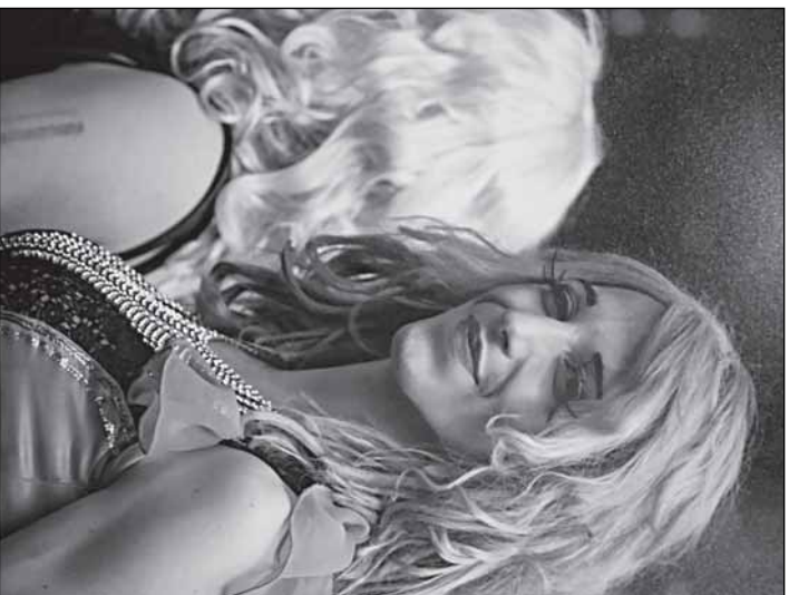
Антоний Киш «Кокетка. Гей-парад на улицах Праги»