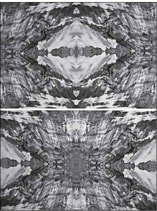
Леонардо Бенчини «Крик внутри»

Киш - фотограф-традиционалист, не склонный к экспериментам, постмодернистским выкрутасам и вообще поиску новых форм и содержания. Новых, то есть лежащих по другую сторо-