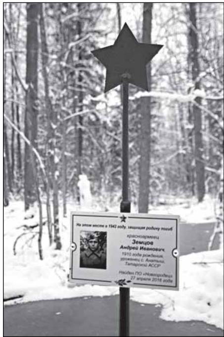
Здесь погиб красноармеец Земцов