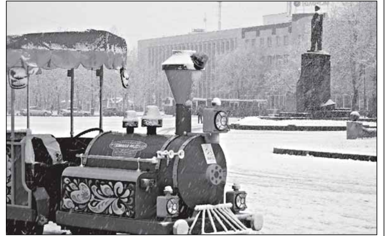
Хорошо, что хотя бы это транспортное средство не пришлось мобилизовать на преодоление кризиса

...Не сомневаемся, что транспортную ситуацию нынешний владелец АО «Автобусный парк» отрегулирует. Но и надеемся, что нормализация положения не даст забыть об истоках кризиса. Властям,