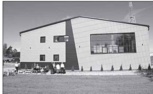
Спорткомплекс в Мойке

тие на 37 мест, чтобы проводить спортивные сборы. Создали федерацию тайского бокса в Новгородской области. И уже провели у себя несколько областных соревнований, следующие - в конце ноября: чемпионат области по тайскому боксу.