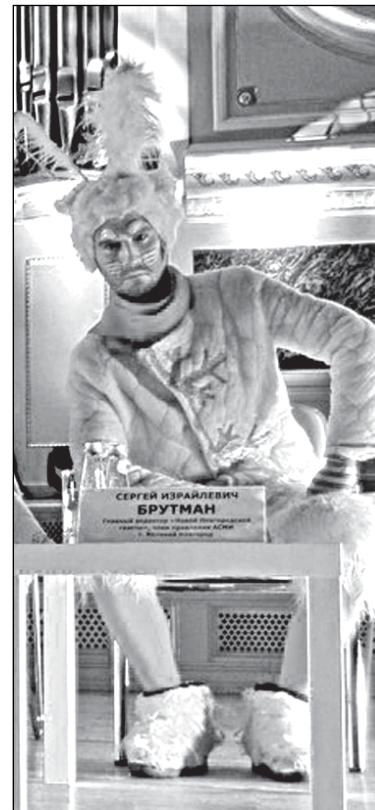
«ННГ» теперь руководят «белые человечки»?