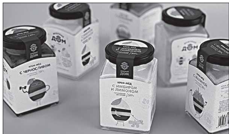
Новые этикетки с пчёлками-ягодками

Окончание - в следующем номере: о «Крестецкой строчке», политике как «отдельном бизнесе» и стоимости часов на руке.