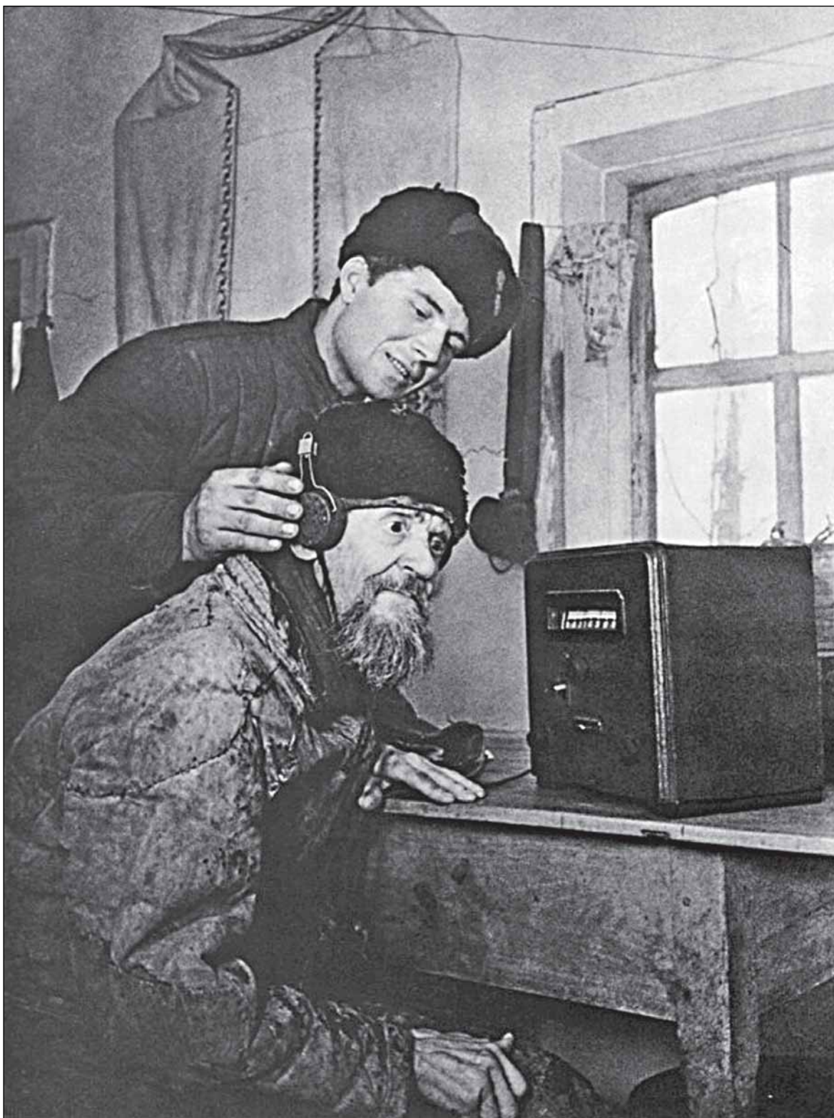
«Голос Москвы». 1943 год.