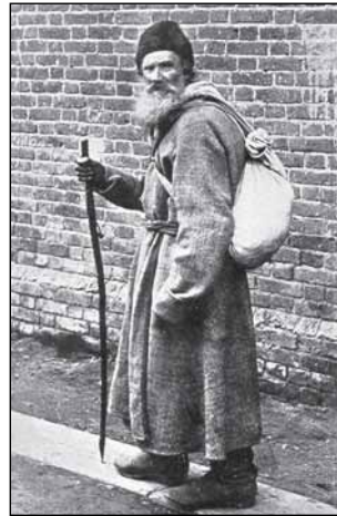
Лев Толстой покидает Ясную Поляну

Надо отметить, что среди членов отделения немало и сотрудни-