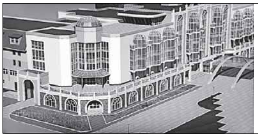
Эскизов уже много, но сначала надо принять концепцию

Эскизы отражают ряд концептуальных подходов. Один из них – привнесение нового, сохранить традиции. К примеру, пологий укрепленный берег с верхним и нижним