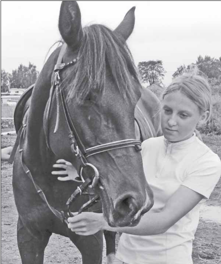
Любаша и Кокетка

кого рысак. Призовые суммы в заездах для орловцев были крайне малы. Сейчас вроде бы принимаются меры по восстановлению численности этой породы, зарегистрированной в Министерстве сельского хозяйства России в 2007 году. Орловские рысаки начали устанавливать новые рекорды. И всё же для спасения породы от гибели потребуются ещё немало усилий в течение десятков лет. Знающие люди говорят, что все основные ипподромы в наши дни заполняют как доморожденные, так и ввозимые из-за рубежа «американцы», и они вытесняют не только орловского, но и русского рысак. А ведь это наша история, наша гордость.