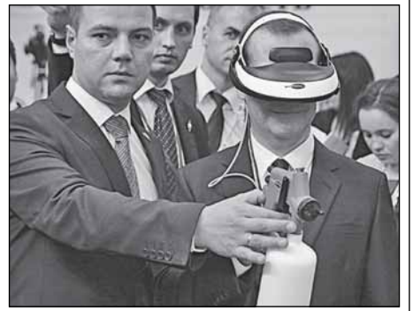
Д. Медведев ушёл в виртуальную реальность

только экономический рост. Или собственная хитрость. Сообщают, что некий житель города Полевской, что на Урале, исхитрился оформить пенсии сразу в двух регионах и исправно получал их. Правда, теперь он разоблачён, ему грозит уголовное дело, и прокуратура намерена взыскать с него весь незаконный «приварок» - более 700 тысяч рублей.