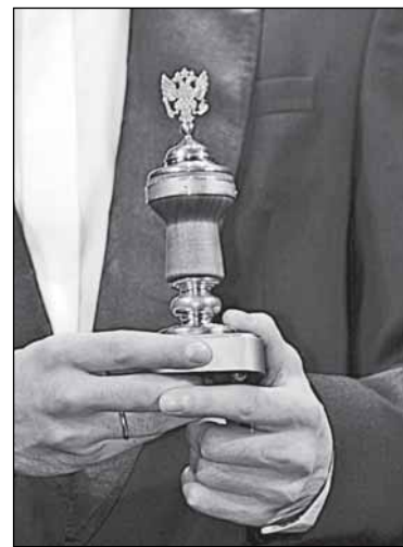
Спорный знак мэрской власти

Рисунок: Максим СМАГИН («Красная бурда»)