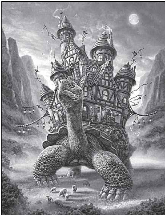
Кемпер, как черепаха, свой дом возит с собой