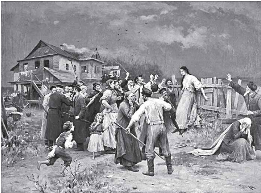
Россия, припёртая к стенке мракобесием своих депутатов

Я специально оставил в середине высказывания цезуру. Вырезано вот что: «Можно только согласиться с законами о присоединении Крыма и Севастополя, и плюс закон о запрете усыновления наших