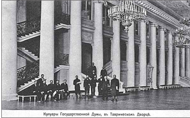
Кулуары Государственной Думы, в Таврическом Дворце.

20 ноября 1908 г. в Думе был поднят вопрос о русских курортах: «Число больных в водах Старорусских, Липецких и Сергиевских сравнительно очень незначительно. Старорусские воды по числу посещающих больных достигли только 3 000 человек в сезон, Липецкая и Сергиевская воды имеют ещё меньшее количество больных, около 1 000 человек каждый из этих курортов. Также точно и сумма годового бюджета этих трёх курортов едва превышает 100 000 рублей в год».