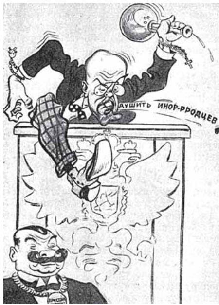
У каждой Думы, в любую эпоху, есть свои зрательные артисты, свои Пуришкевичи. Пуришкевича нашего времени вы знаете сами

Вопрос, где лучше отдыхать, за границей или на родине, был актуален и тогда: «Потребность в лечебных местах для русских слишком велика и не только потому, что нам нужно удержать те миллионы, кото-