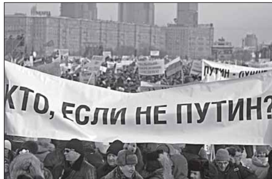
Кот Бегемот - живая иллюстрация к «войне плакатов» 2012 года, когда на вопрос «агрессивно-послушного большинства» оппозиция нашла ёрнический, зато весёлый «симметричный ответ»

По их словам, кот обязуется отдавать всю депутатскую зарплату на благотворительность.