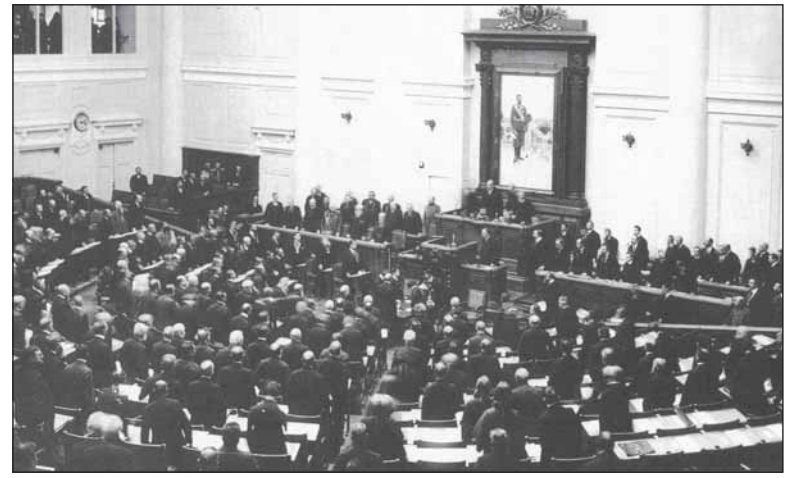
Заседание 3-й Государственной думы

Ещё один актуальный вопрос: что важнее: здоровье нации или возможность получения прибыли? И здесь имелись немалые сложности: «Мы встречаемся, например, с таким положением: в этом году на Кавказских водах администрация нашла необходимым сократить бесплатную выдачу малоимущим больным ванн и лечебных пособий, говоря, что на это уходит ежегодно 80 000 рублей казённых денег.