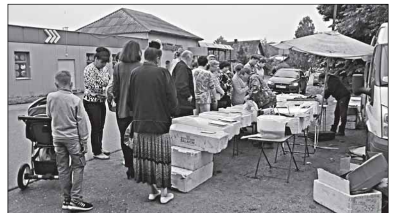
Валдай. Уличная очередь за рыбой. За рыбой - морской. Кальмара в озёрном краю купить проще, чем местную речную рыбу