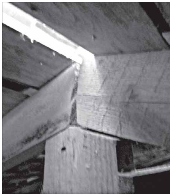
Разъезжающиеся стропила, отсутствие должного крепления деревянных элементов крыши. Пластины крепления нет.