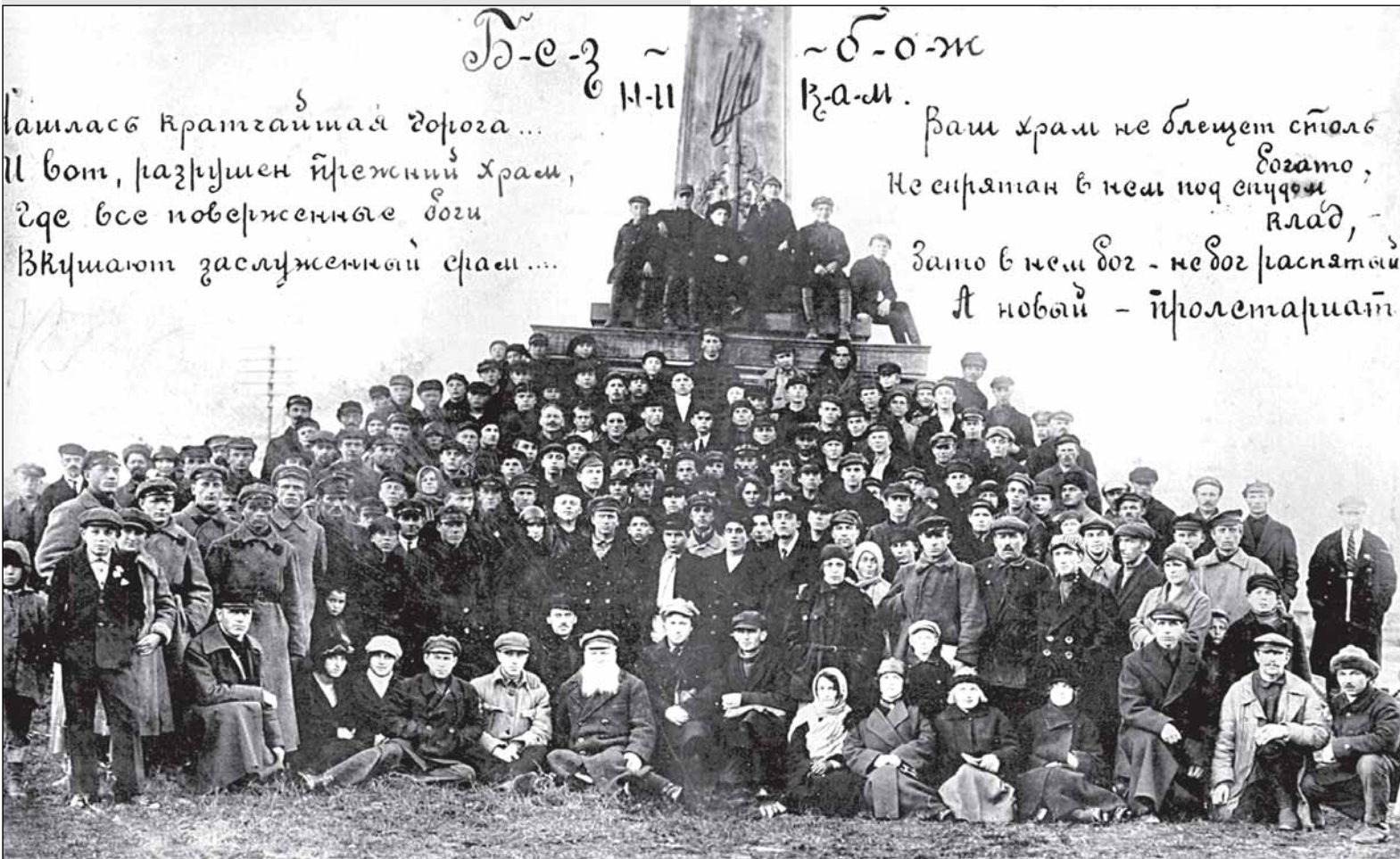
Участники 1-й Новгородской городской конференции «Союза безбожников» около памятника Новгородскому ополчению 1812 г. 15 октября 1925 г.