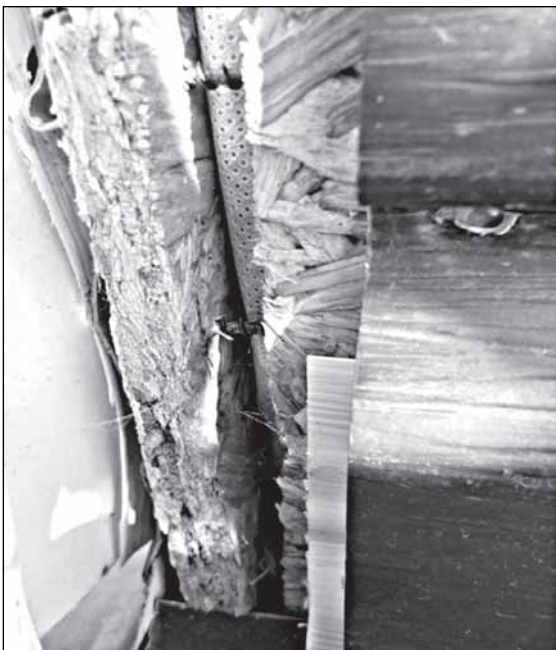
Угловое крепление OSB-панелей без брусков, щели, дыры обшивки, отсутствие влагозащитных плёнок.

Вот как выглядит в посёлке Волот «торт» для детей-сирот, за который они, видимо, должны то ли молча кланяться строителям и местной власти, то ли голосить «спасибо» (снимки из экспертного заключения А. Михайлова):